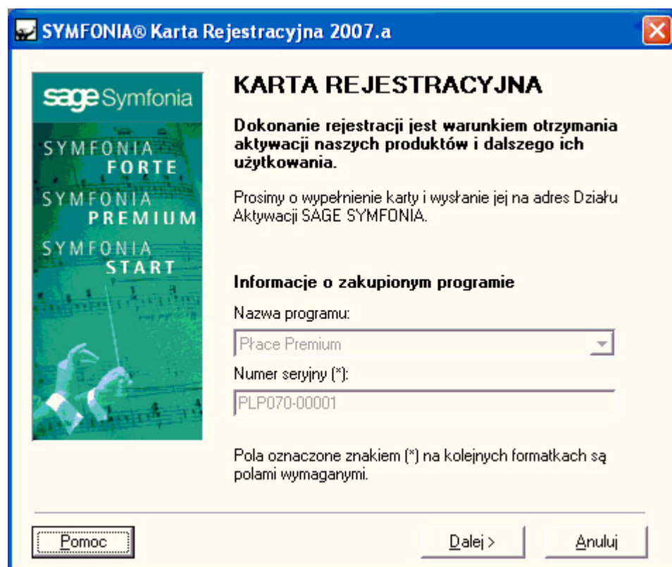
Rys. 1 Dialog Karta rejestracyjna.

Po uruchomieniu programu pokazuje się okno powitalne.